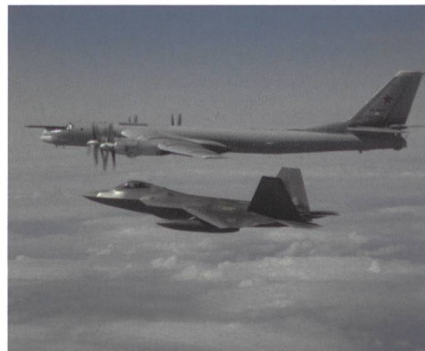
F-22 Raptor fängt Tu-95 ab.

Am Montag, den 20. Mai 2019, konnten US-amerikanische F-22 Raptor Abfangjäger vier Langstreckenbomber des Typs Tu-95 Bear Bomber über neutralen Gewässern vor Alaska abfangen. Die vier Tu-95 Bomber befanden sich laut russischen Angaben auf einem routinemässigen Patrouillenflug über internationalen Gewässern vor Alaska. Die vier grossen Turboprop-Bomber wurden von zwei Su-35 Kampffjets begleitet. Die Bear Bomber waren länger als 12 Stunden in der Luft, solche Langstreckenflüge gehören zur Routineaufgabe der russischen Bomberbesatzungen.