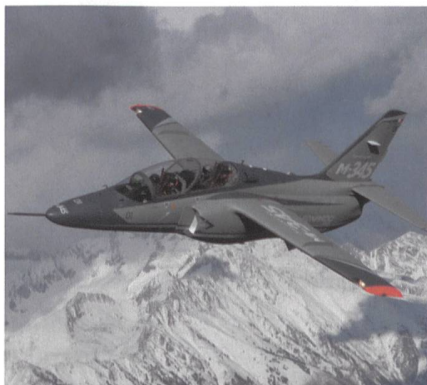
Trainingsflugzeuge M-345 für Italien.

Die neuen Flugzeuge, von denen das erste voraussichtlich 2020 ausgeliefert wird, werden die Flotte der 18 zweistrahligen Aermacchi M-346 (T-346A) ergänzen,