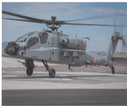
AH-64E (I) für Indien.

Indien konnte im Mai seinen ersten AH-64E (I) Apache übernehmen, die ersten Kampfhelikopter dieses Typs werden im Juli nach Indien überführt. Der erste von 22 bestellten AH-64E (I) Apache wurde im Boeing Werk in Mesa feierlich an die indischen Luftstreitkräfte übergeben. Die ersten Helikopterbesatzungen und das zugehörige Bodenpersonal wurden bei der US Army in Fort Rucker, Alabama, ausgebil-