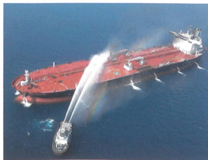
Front Altair: Gelungene Löschaktion.