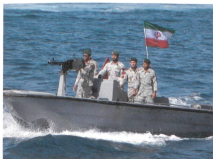
April 2019: Iranische Revolutionswächter paradien auf einem Schnellboot.