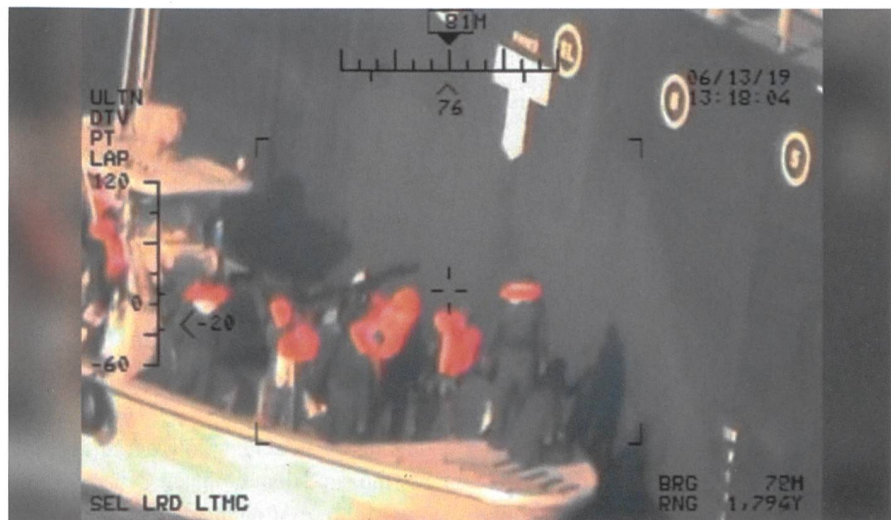
Das unscharfe Video soll beweisen, dass Iraner an der Kokuka eine Haftmine entfernen. Zu erkennen sind das T und mehrere Kreise des japanischen Schiffes.