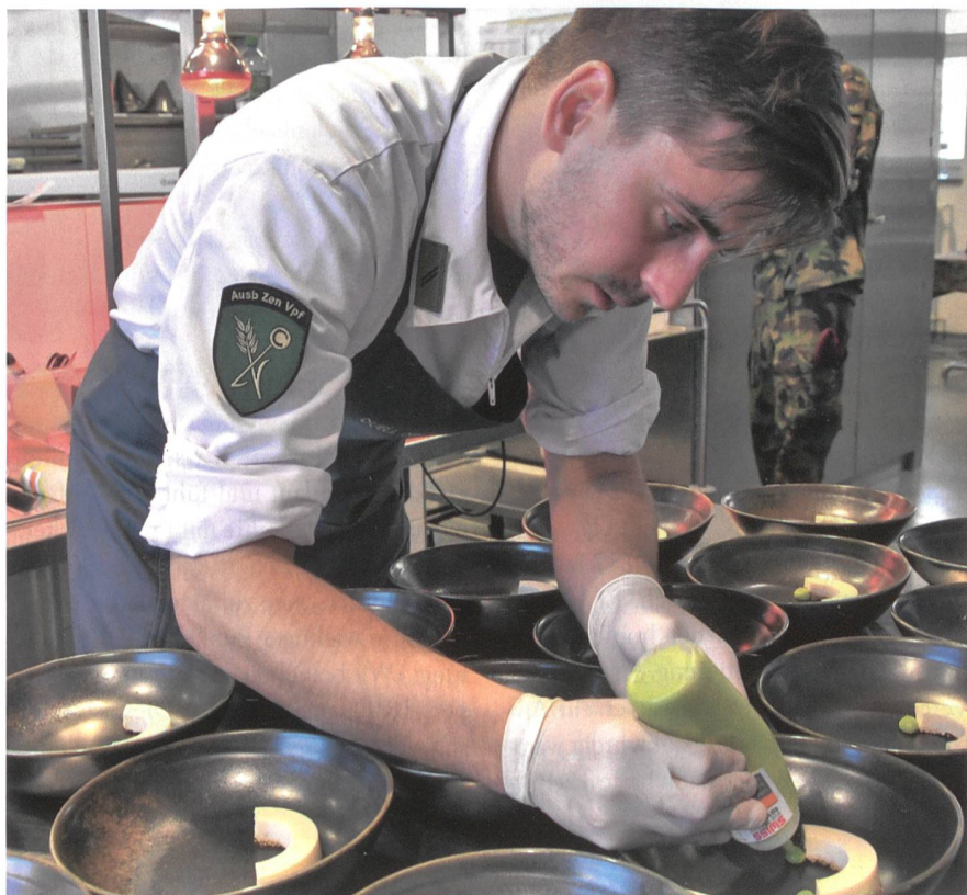
Ein Champion am Werk.

Die mediale Streuung dieses hervorragenden Resultats hilft mit, junge Frauen und Männer der Lebensmittelbranche für die Funktion des Truppenkochs zu begeistern. Denn eines ist sicher: Erfolg erhöht die Attraktivität. cm./log.