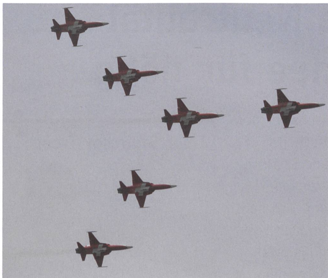
Die Patrouille Suisse über Emmen.