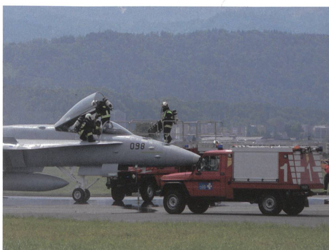
Ein F/A-18 und die Feuerwehr – ein seltenes Bild.