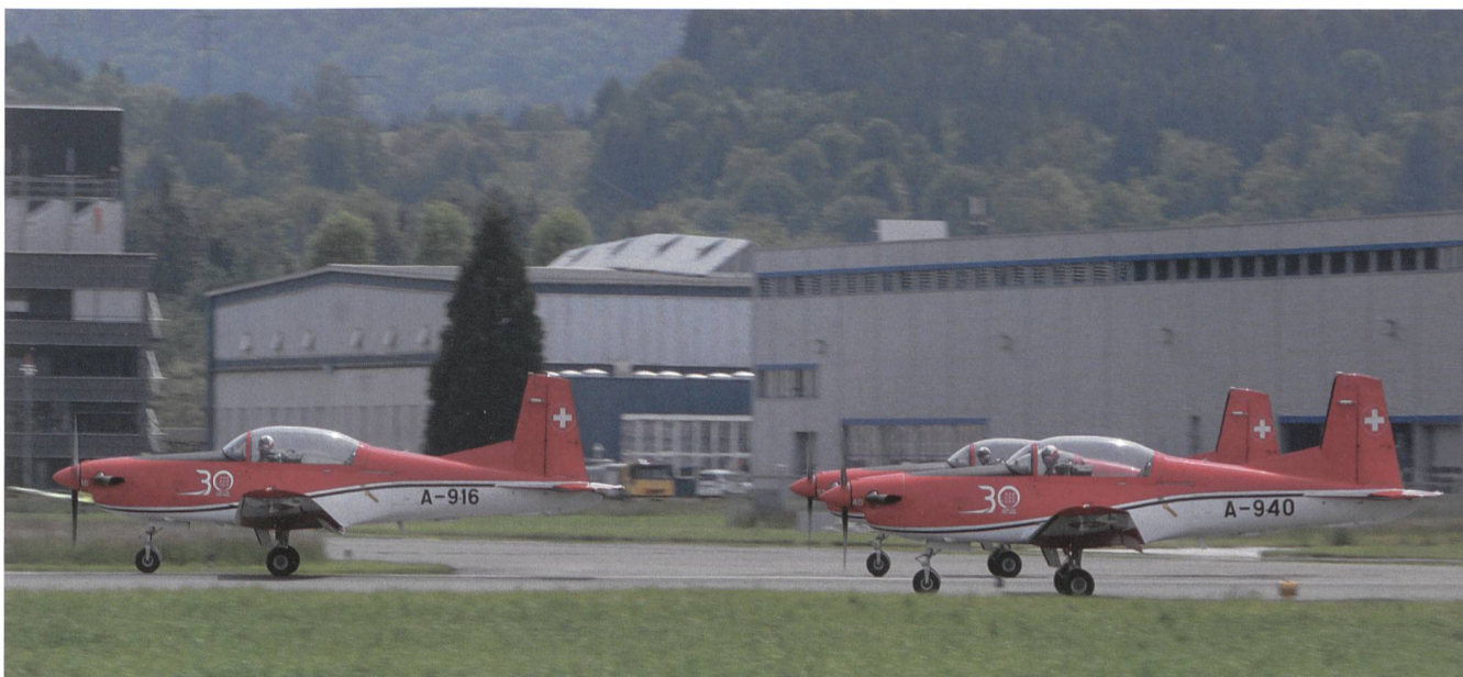
Das PC-7-Team. Die Zahl 30 stammt von seinem runden Geburtstag.