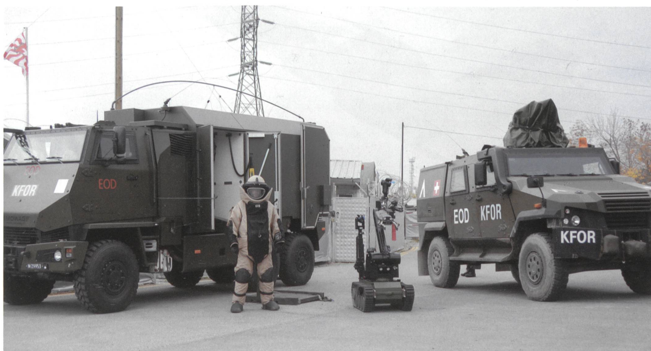
Unter die Haut ging das Bild vom Plus-40-Kilogramm-Mann, der vor einem anspruchsvollen, kritischen Einsatz den schweren Schutzanzug trägt. Zu erkennen sind auch der Duro III P, der Eagle IV und eine Fernlenkplattform.