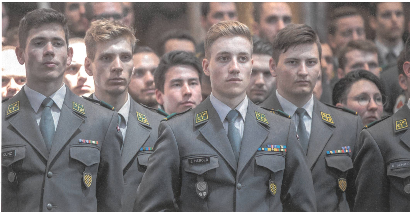
Mit gebührendem Ernst erwarten die 100 Aspiranten – fünf Frauen und 95 Männer – die Brevetierung zum Leutnant.