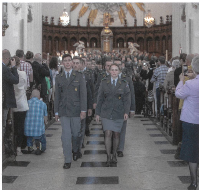
Der Ausmarsch der neuen Zugführer aus der Kathedrale.