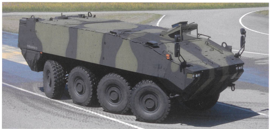
Auf dem MOWAG-Testgelände in Bürglen.

Es folgte der Abschlussabend mit der Rangverkündigung vom Schiessen und dem Austausch von kleinen Erinnerungsgeschenken. Mit vielen lehrreichen Erfahrungen und Erlebnissen mit neugewonnenen Freunden reisten die Berufsunteroffiziere am Freitag in den Urlaub. ☝