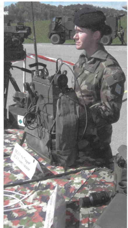
Frau + Technik (Frankreich)

Die Unteroffiziere aus Deutschland, Frankreich und der Schweiz massen sich am Donnerstag bei einem Wettschiessen mit dem Sturmgewehr 90 und der Pistole 75. Am Nachmittag gab es eine Demonstration von Fahrzeugen auf dem MOWAG-Testgelände in Bürglen.