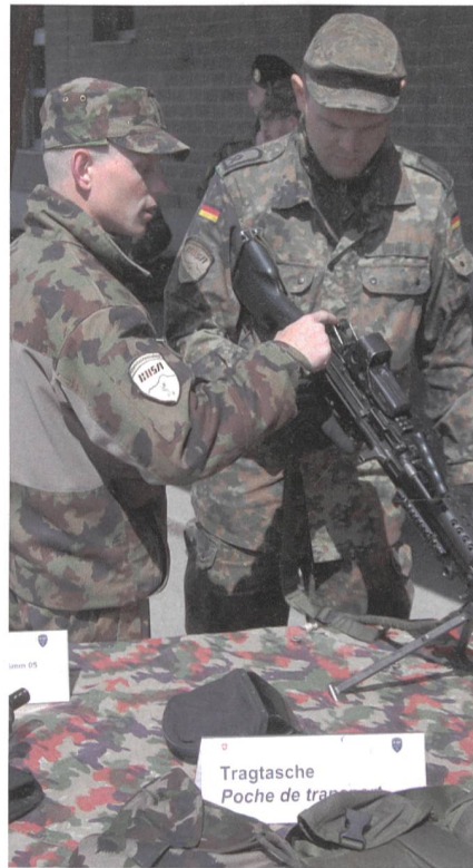
Instruktion am LMg.