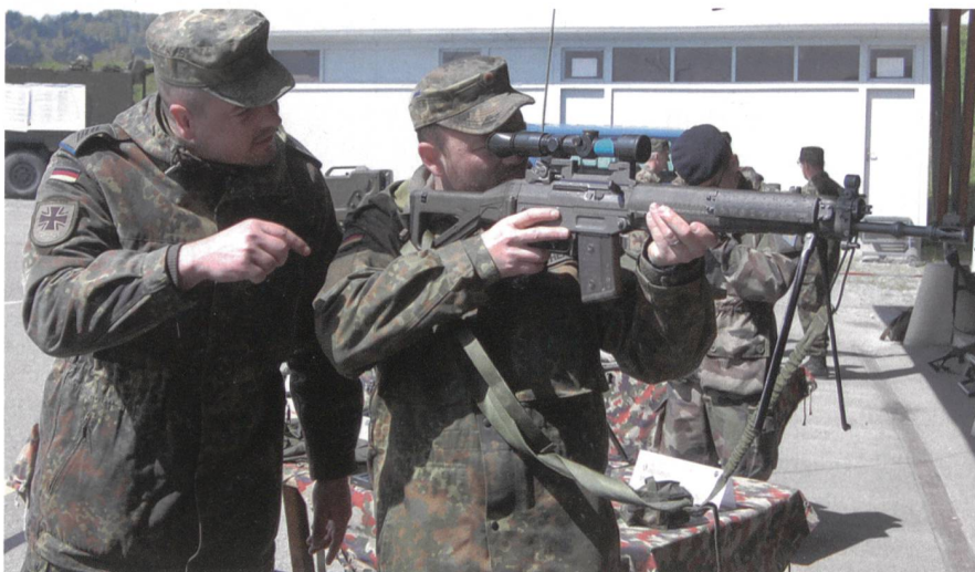
Stgw 90 mit Zielfernrohr. Deutsche Gäste.

Als Blick in die nahe Zukunft darf die Information über die neue Bekleidung (MBAS) der Schweizer Armee bewertet werden. Hernach erfolgte die Ausbildung an Waffen und Geräten, um die Grundlagen für die Verbandsausbildung in gemischten Gruppen vom Mittwoch zu legen. Intensive Übungen im Verband hielten alle den ganzen Mittwoch in Aktion.