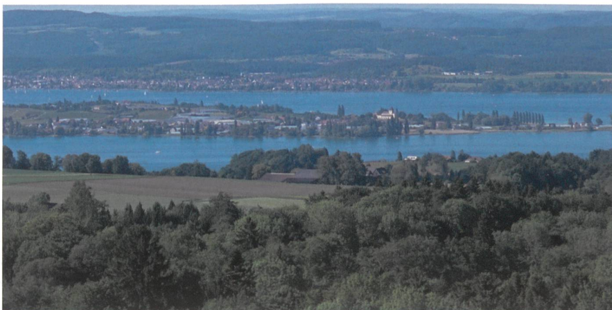
Blick von Hohenrain auf die Reichenau.