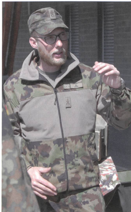
Hptfw Kühnis informiert.

Mit Deutschland funktioniert der Austausch mit der Unteroffiziersschule des Heeres (USH) seit 2002. Dieses Jahr fand der Austausch in der Woche vor dem trina-