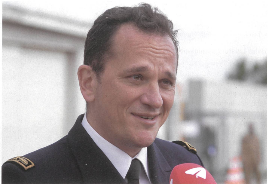
Général Vincent Thomassier, Délégation Général de l'Armement beim Interview.

FREEDOM» in Afghanistan, der Operation «UNIFIED PROTECTOR» in Libyen oder der Operation «INHERENT FREEDOM» gegen den Islamischen Staat in Syrien und im Iraq. Das Einsatzspektrum des Rafale umfasst unter anderem