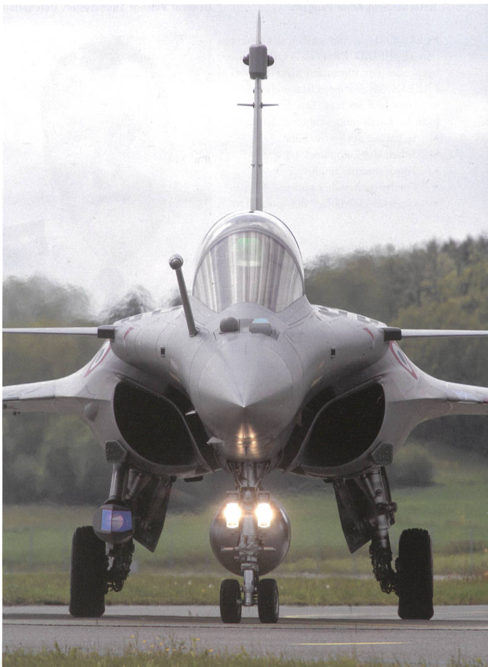
Der Rafale mit seiner markanten Silhouette.