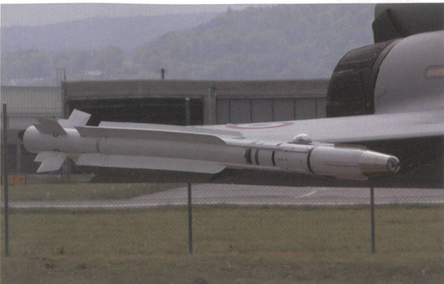
MICA-Luft/Luft-Raketen mit IR-Suchkopf am Flügelende.