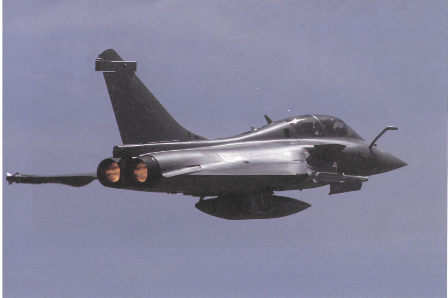
Der Rafale-Doppelsitzer kurz nach dem Start zu einem Erprobungsflug.