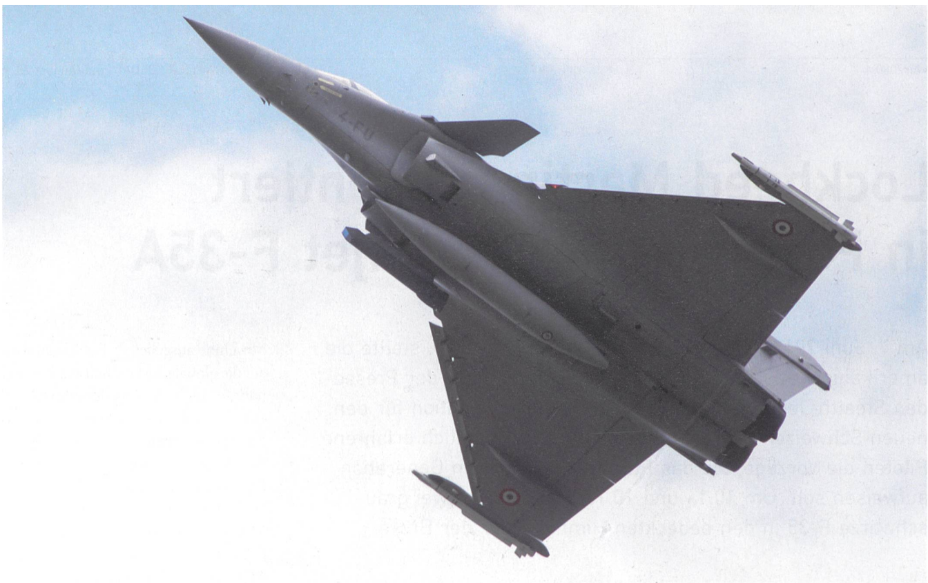
Der Rafale 4-FU mit einem 1250-lt-Zusatztank (Mitte), 2 MICA-Luft/Luft-Raketen mit IR-Suchkopf an den Flügeln und einem Sniper-Targeting-POD links vom Zusatztank.