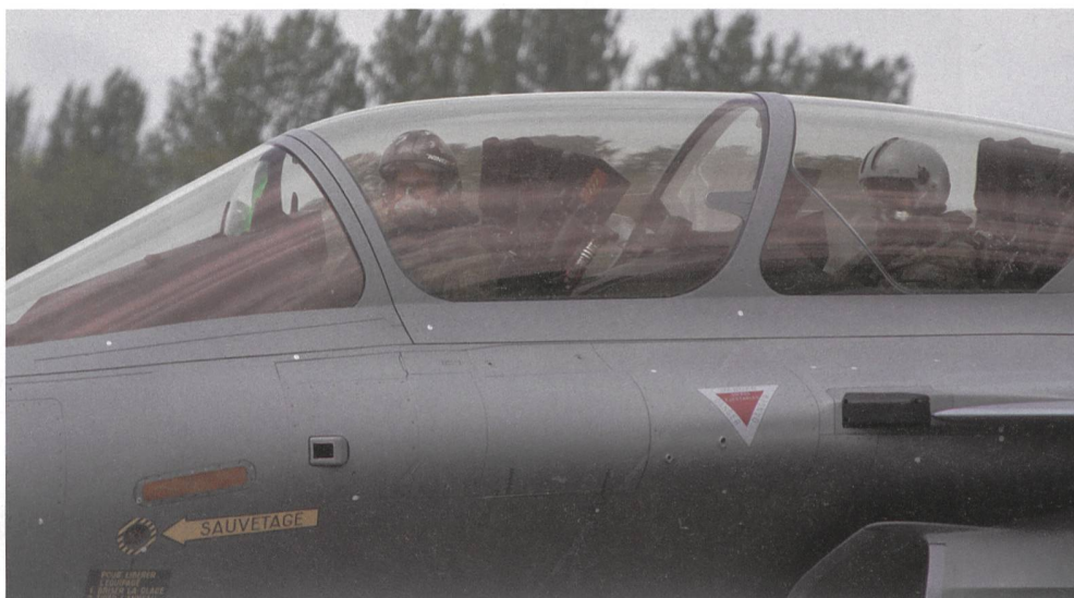
Die beiden Piloten nach der Rückkehr in Payerne.

Der Rafale hat bereits in verschiedenen alliierten Task Forces in Einsatz gestanden, so bei der Operation «ENDURING