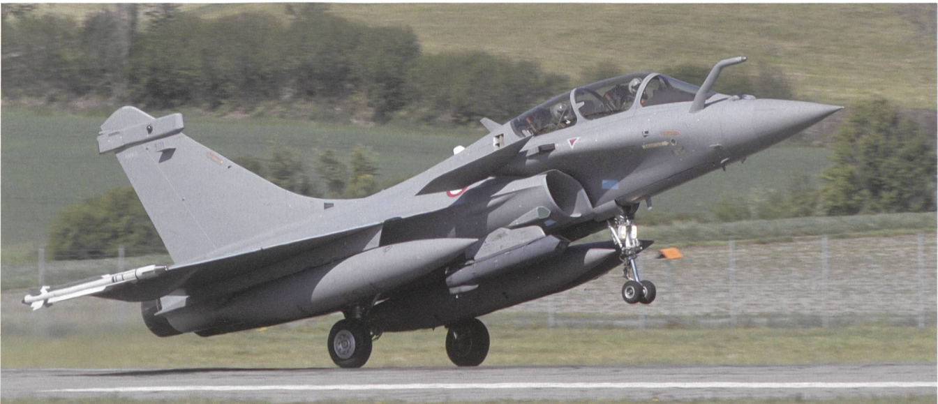
Der Rafale verfügt über eine Aussenlastzuladung von bis zu 9,5 Tonnen.