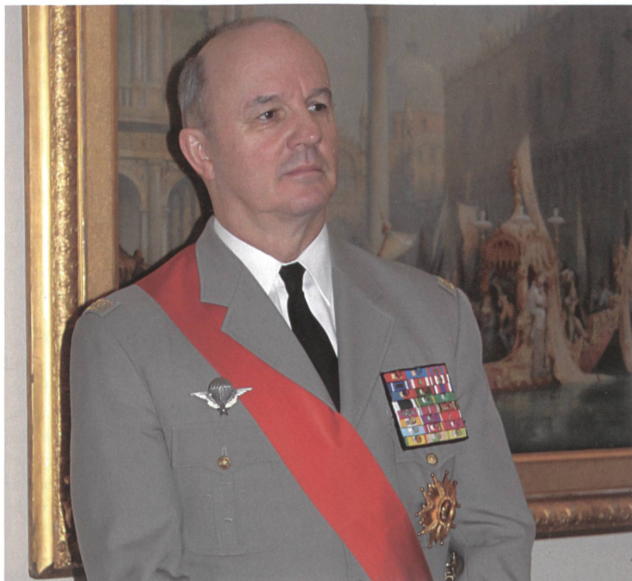
Der Fünf-Sterne-General Georgelin leitet den Wiederaufbau von Notre-Dame.