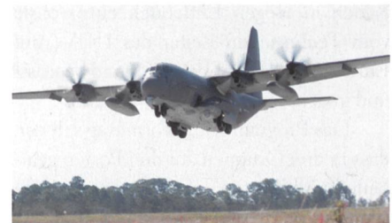
Neue Block 30-Variante des AC-130J-Gunships.

Die 4th Special Operations Squadron hat als erste Einheit der US Air Force die neueste Ausführung der Lockheed Martin AC-130J in Empfang genommen. Äusserlich