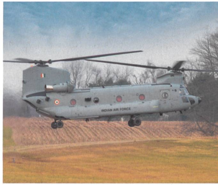
Indienststellung der ersten indischen CH-47F(I) Chinook.

Die indische Luftwaffe (IAF) hat Ende März ihre ersten vier von 15 Boeing CH-47F(I) Chinook offiziell in Dienst gestellt. Die vier Helikopter waren per Schiff schon Mitte Februar im Hafen Mundra in Gujarat eingetroffen. Die Chinooks sollen in den nördlichen und östlichen Regionen In-