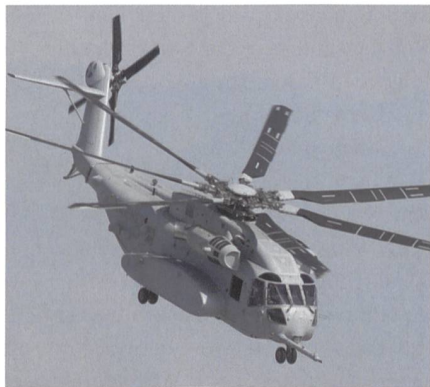
Sikorski CH-53K als möglicher STH für Deutschland.

Gefordert wird die Beschaffung der STH-Flotte nebst logistischer Betreuung in einem Paket. Es geht um «mindestens 44 und maximal 60 schwere Transporthelikopter» in einem «Lieferzeitraum von acht Jahren». Laut Ausschreibung erstreckt sich das Aufgabenspektrum der zu beschaffenden STH-Flotte auf den Lufttransport von Personal und Material sowie Sonderaufga-