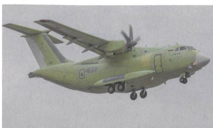
Jungfernflug des neuen russischen Transportflugzeugs Il-112W.

Dem Erstflug der Il-112W ging ein umfangreiches Bodentestprogramm voraus, bei dem alle Systeme überprüft wurden. Zuletzt gab es Hochgeschwindigkeits-Rollversuche, bei der die Maschine auch