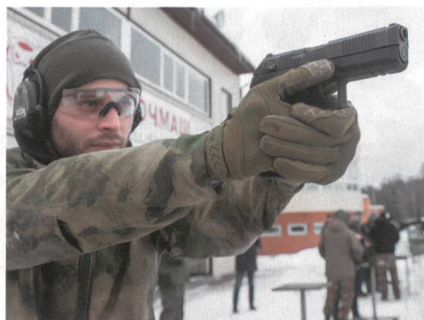
Udav als möglicher Nachfolger für die altbewährte Makarov.

In den russischen Streitkräften gibt es Überlegungen, die derzeit genutzte Makarov-Pistole durch ein moderneres Modell