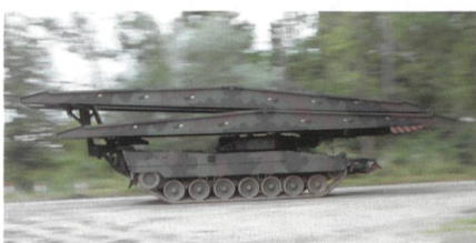
Brückenpanzer Leguan für Norwegen.

Das norwegische Beschaffungsamt (NDMA) und Krauss-Maffei Wegmann haben einen Vertrag über die Beschaffung von sechs Leguan-Brückenlegern auf Leopard-2-Fahr-