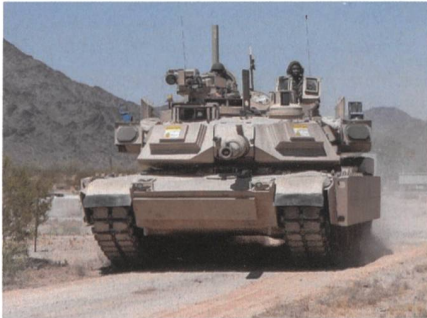
Aktives Schutzsystem auf einem Amerikanischen Abrams.

Nach Integrationsuntersuchungen in den vergangenen Jahren werden Leopard 2 der Bundeswehr jetzt mit dem aktiven Schutzsystem Trophy von Raphael ausgestattet. Der Plan sieht vor, einen Teil der Kampfpanzer bis 2022 mit Trophy-Systemen auszustatten. Diese Kampfpanzer sollen dann