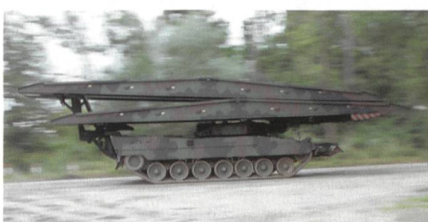
Brückenpanzer Leguan für Norwegen.

Das norwegische Beschaffungamt (NDMA) und Krauss-Maffei Wegmann haben einen Vertrag über die Beschaffung von sechs Leguan-Brückenlegern auf Leopard-2-Fahr-