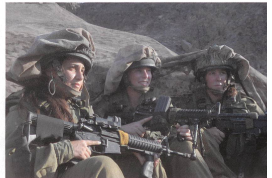
Aufklärung an der Nordfront. Seit dem Jahr 2000 stehen in Israel sämtliche Funktionen Frauen und Männern offen.