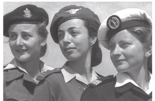
Frauen in der israelischen Armee 1948: Heer (Unteroffizier), Luftwaffe (Ober- leutnant), Kriegsmarine (Hauptmann).