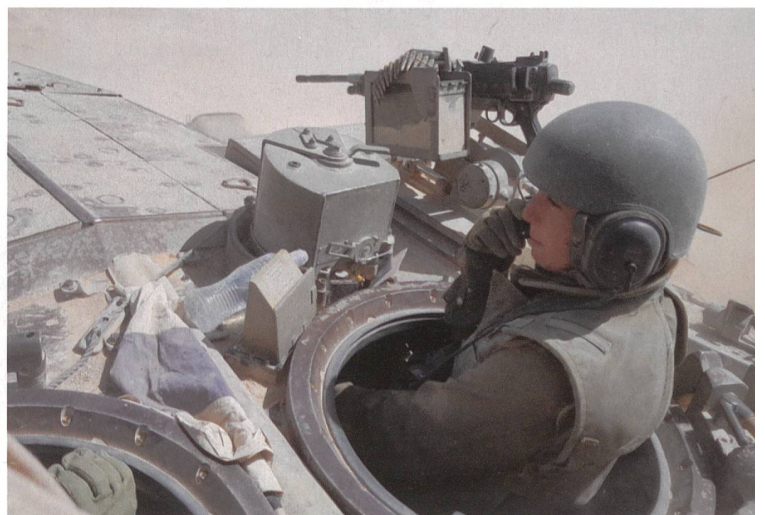
Israel: Panzerkommandant führt Merkava-Tank ins Gefecht.