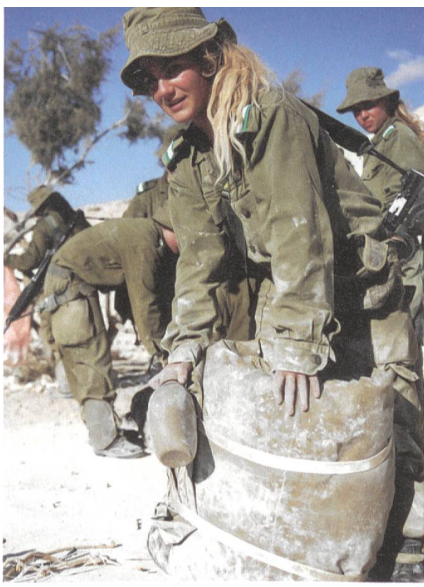
Israel: Wüstenmarsch der Infanterie.