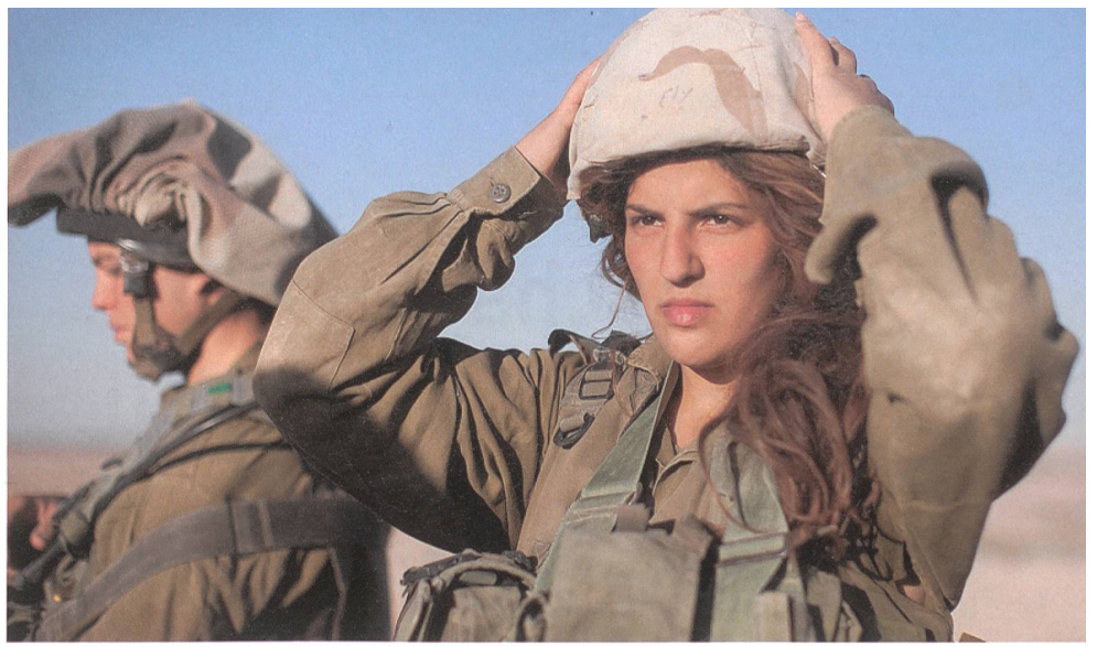
Im israelischen Caracal-Bataillon erfüllen Frauen im Negev Kampfaufträge.