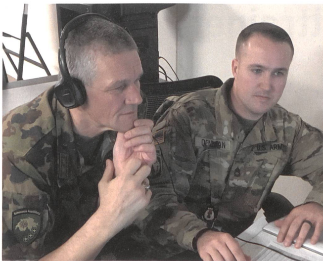
Im Rekrutierungszentrum der US Army.