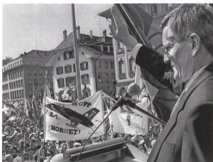
Die Kundgebung der Schützen und Soldaten pro F/A-18 auf dem Bundesplatz im Mai 1993 mit EMD-Chef Villiger.