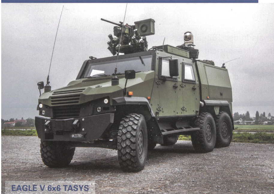
EAGLE V 6x6 TASYs

GENERAL DYNAMICS European Land Systems-Mowag