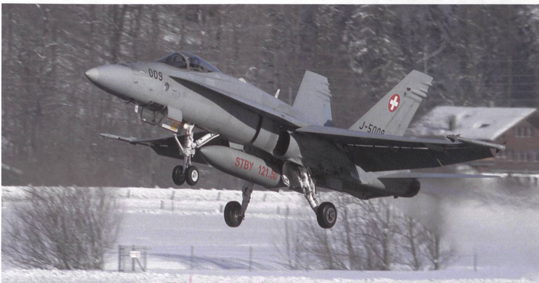
1993 waren es die Schützen, die dem F/A-18 zum Durchbruch verhalfen; wie auch den Waffenplätzen.