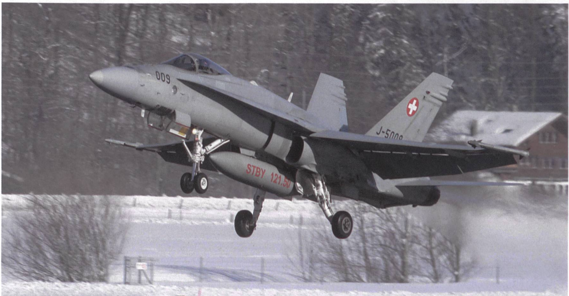
1993 waren es die Schützen, die dem F/A-18 zum Durchbruch verhalfen; wie auch den Waffenplätzen.