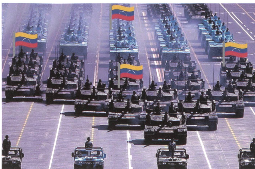
Parade 3, Caracas: Défilé der 1. Panzerbrigade der 4. (einzigen) Panzerdivision.