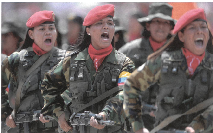
Paradebild Nummer 1 aus Caracas. Frauen in Kampftruppen: 1. Infanteriedivision.

Wer in Caracas um Armeebilder bittet, der wird luxuriös versorgt – mit Fotos von zähnefletschenden, tanzenden Parade-soldaten. Die Kampfkraft der venezolanischen Streitkräfte ist jedoch umstritten: In den USA zweifeln Beobachter das Training und den Korpsgeist der 115 000 Mann starken Armee an; andere erinnern an die Waffen, die Russland Maduro liefert.