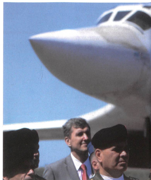
Russischer Langstreckenbomber Tu-160 in Vene

Das Heer umfasst zunächst einmal die 4. Panzerdivision mit einer Panzer-, einer Panzergrenadier-, einer Luftlande- und einer Artilleriebrigade. Die 1. Panzerbrigade führt 92 T-72B1 ins Gefecht.