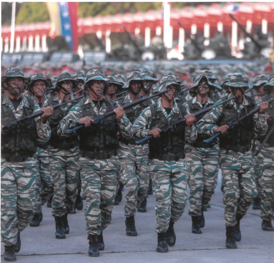
Parade 2. Das männliche Pendant: Unteroffiziere der Spezialkräfte der 1. Inf Div.

Wie zu allen Nationen gibt das Internationale Institut für Strategische Studien in London, das IISS (nicht zu verwechseln mit der Terrorbande ISIS) auch zu Venezuela präzise, gesicherte Informationen.