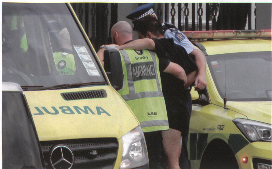
Ein Sanitäter und ein Polizist bringen einen Verwundeten zum Krankenwagen.