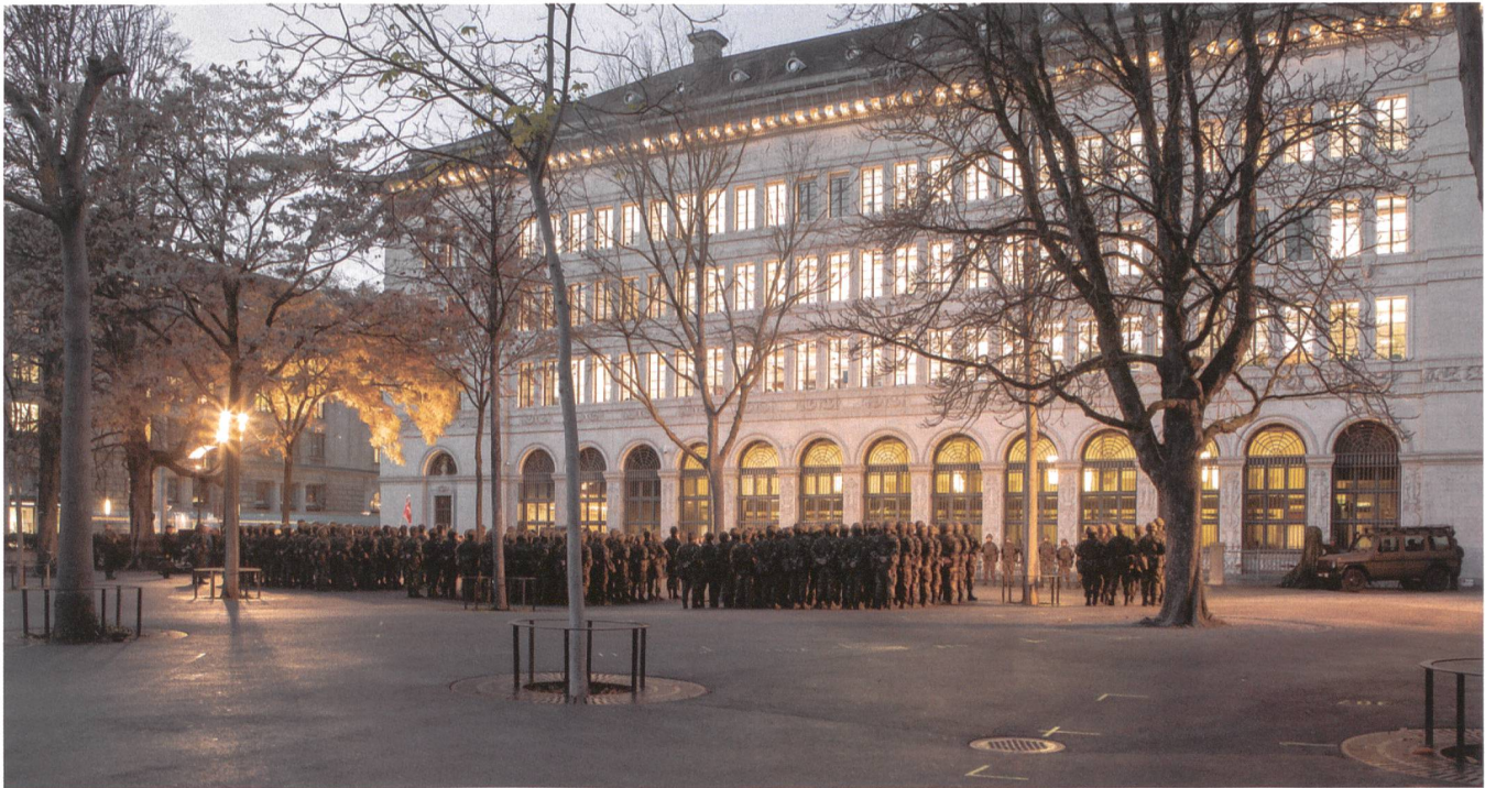
Stimmungsvolle Standartenrückgabe auf dem Bürkliplatz in Zürich, vor der Nationalbank.