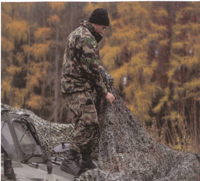
Gut tarnen – das gehört dazu!