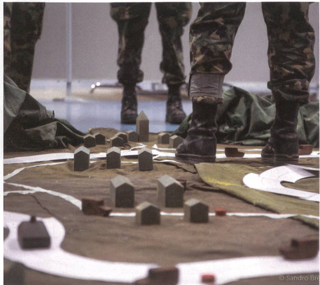
Taktischer Dialog am Geländemodell.