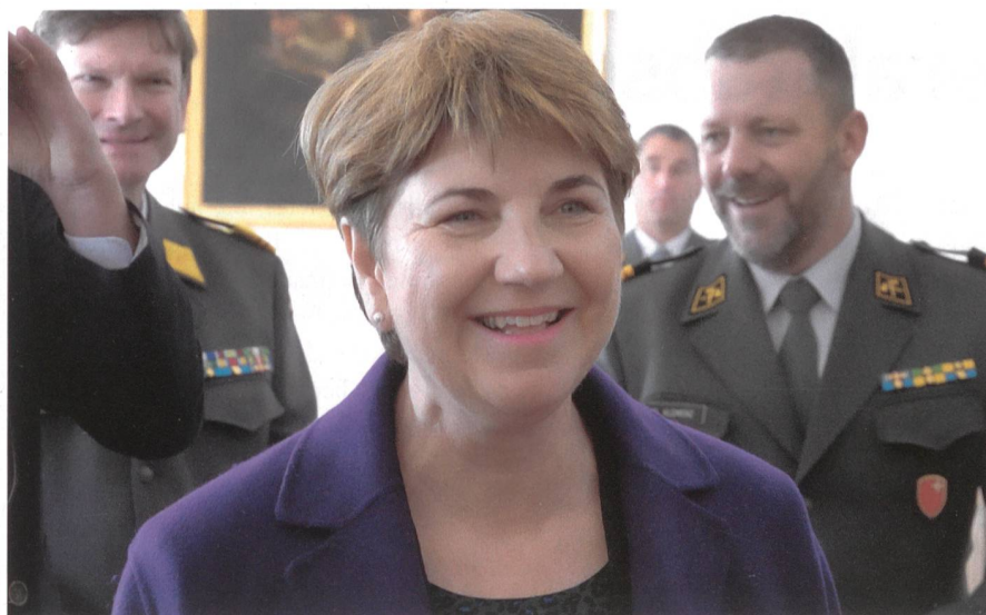
Bundesrätin Viola Amherd zu Gast bei der SOG im Kloster Einsiedeln.

Aus dem Kloster Einsiedeln berichtet Chefredaktor Peter Forster, Delegierter der KOG Thurgau