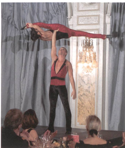
Weltklasse: Das Akrobatenduo OGOR.