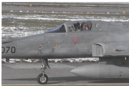
Kooperation mit USA seit 1976: F-5.

Die Weiterentwicklung von zivil und militärisch nutzbaren Technologien wird sich stark auf die Leistungsfähigkeit und