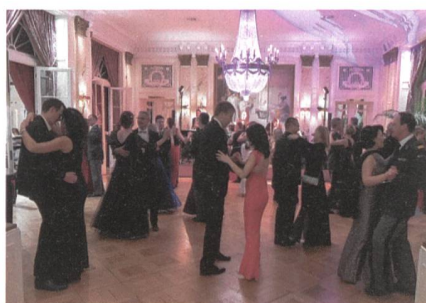
Tanz im Salon d'Honneur des Bellevue.

Brillanter Ball im Berner Bellevue Schon zum 13. Mal fand der Ball der Berner Offiziere in den stilvollen Räumlichkeiten des Hotels Bellevue Palace gleich beim Bundeshaus-Ost statt. Mehrere hundert Ballgäste hatten sich im Bellevue ein-