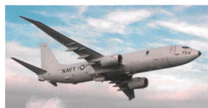
Bestellung von weiteren P-8A Poseidon.