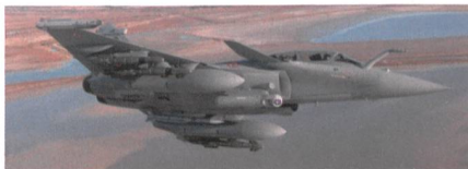
Der Rafale wird modernisiert.

Das französische Verteidigungsministerium hat bei Dassault 28 weitere Rafale Kampffjets bestellt und erhöht damit den Festauftrag auf 180 Maschinen, zudem wurde zusätzliches Geld für die Weiterentwicklung auf den F4 Standard freigegeben. Die französische Verteidigungsministerin