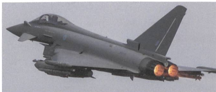
Britischer Eurofighter FGR4.

Mit einigen Monaten Verzögerung wurde das Feld der Tornado-Nachfolgekandidaten bei der Luftwaffe auf zwei Muster reduziert. Weitere Untersuchungen betreffen nun noch den Eurofighter und die Super Hornet von Boeing. Neben dem Eurofighter bleibt die F/A-18 Super Hornet im Rennen um die Tornado-Nachfolge. Sie