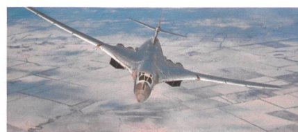
Modernisierung des ersten Tu-160.

Das Flugzeug wird «mit einzigartigen Waffen ausgestattet sein, was seine Kampffähigkeiten beim Einsatz von konventionellen und nuklearen Waffen erheblich erweitern wird», so das russische Verteidigungsministerium. Darüber hinaus wird es mit dem neuesten EloKa-System, einem modernen, zuverlässigen Kommunikationssystem mit verbesserter Störsicherheit und NK-32-Triebwerken der zweiten Baureihe