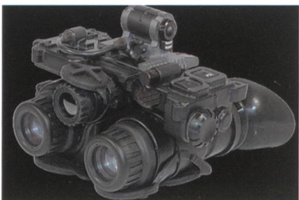
Zusätzliche Bestellung von FGE-Nachtsichtbrillen der 3. Generation.

IEA Mil-Optics GmbH erhält einen weiteren Auftrag der Bundeswehr zur Lieferung von binokularen Fusions-Nachtsichtbrillen FGE (Fusion-Goggle-Enhanced) mit ungefilzten schwarz/weiss Röhren der 3. Generation. Das Gesamtvolumen beläuft sich auf über 10 Mio. €. Die FGE Brille ist ein binokulares System, welches ein 3-di-