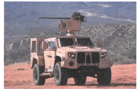
Oshkosh JLTV für Slowenien.

Slowenien hat im Rahmen von Foreign Military Sales über die US-Regierung 38 Joint Light Tactical Vehicle (JLTV) im Wert von 16 Mio. Euro bestellt, die ab 2021 unter der