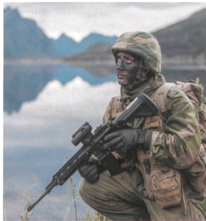
Norwegischer Soldat mit HK416.

Das norwegische Verteidigungsministerium hat den deutschen Handwaffenhersteller Heckler & Koch mit der Lieferung von 11 000 HK416 Sturmgewehr-Sets beauftragt. Der Lieferauftrag im Wert von 22 Millionen Euro beginnt dieses Jahr und läuft über 36 Monate. Von den neuen Waf-