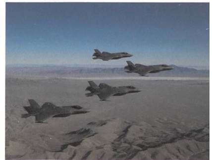
F-35 Lightning II: «RED FLAG» Attacke.