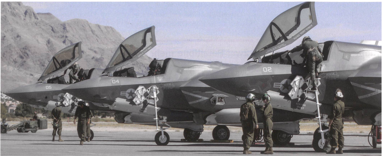
F-35 Lightning II auf der Nellis Air Force Base, dank 15 000 Quadratmeilen Luftraum einer der grössten Stützpunkte der Welt.