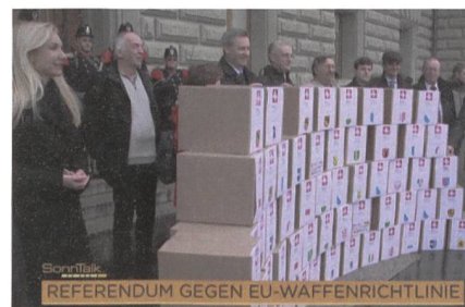
Als positiv wurde die Medienpräsenz im Tele Züri eingestuft.