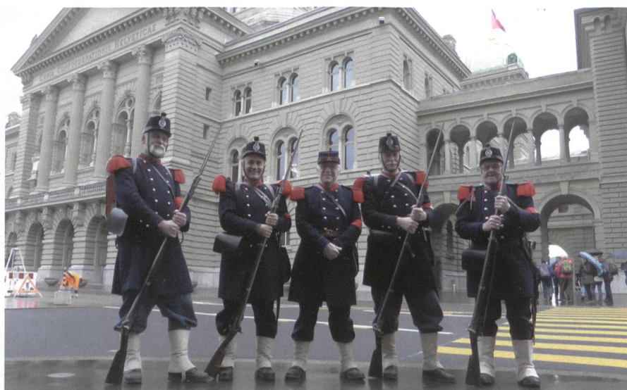
Die Ehrenwache der Cp 1861 in ihren würdigen Uniformen vor dem Bundeshaus.