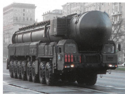
Raketenystem in der Stadt Moskau.