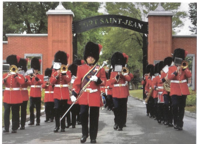
Traditionspflege am Fort Saint-Jean.