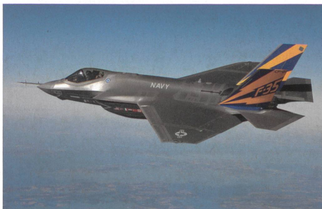
Lockheed Martin, USA: F-35A Hier die Navy-Version B.