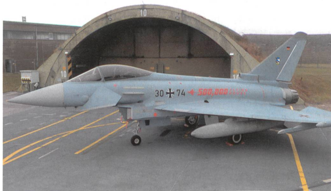
Airbus steigt mit dem Eurofighter Typhoon ins Rennen.

Anfang April 2019 veröffentlicht das VBS auf seiner Internetseite die Detailangaben zu den Besuchstagen. vbs.