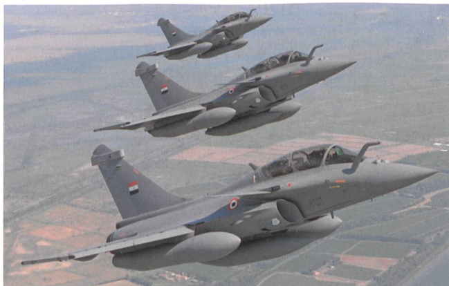
Dassault tritt mit dem Rafale zur Schweizer Evaluation an.