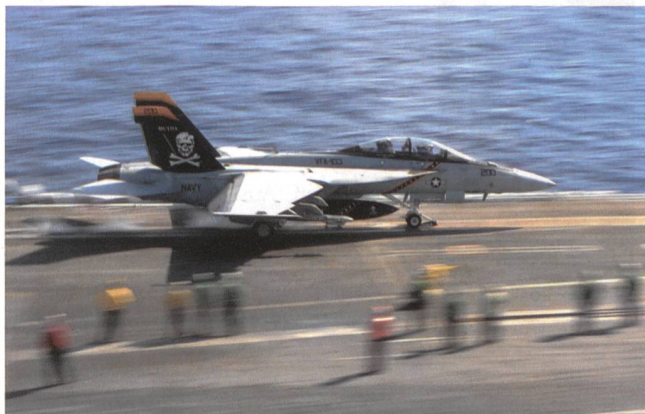
Boeing, USA: F/A-18 EF – Navy-Version landet auf Träger.