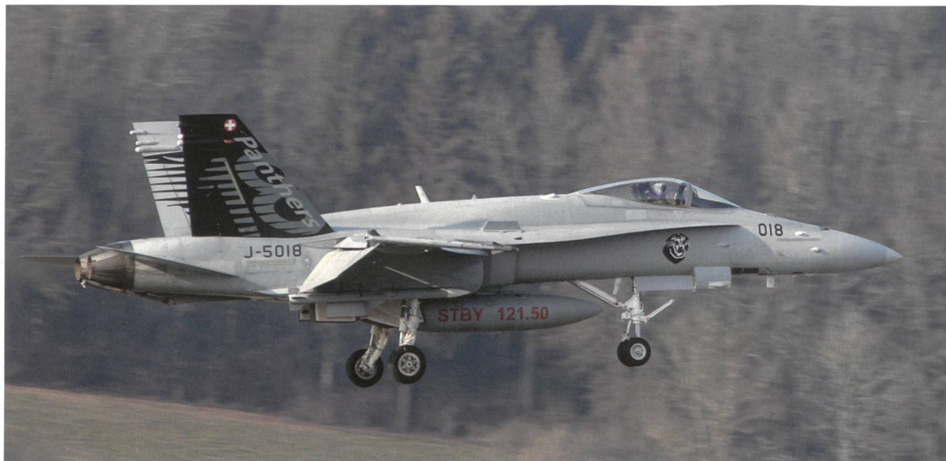
Im vergleichsweise grünen Payerne setzt die Staffelmaschine 18 der «Panthers» zu einer Landung an.