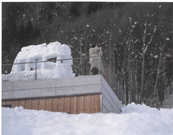
Auf einem Wachtposten kurz vor Davos, gut geschützt.