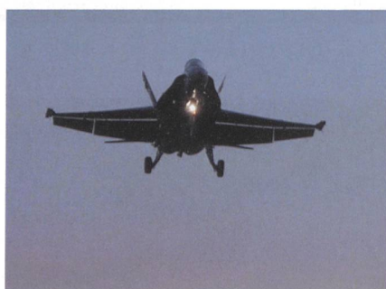
Nachtanflug eines Jets der Luftwaffe.