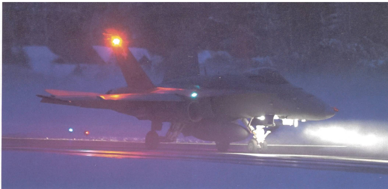
Tag und Nacht, rund um die Uhr, wachen unsere Piloten. Der F/A-18 J-5007 startet im winterlichen Meiringen.