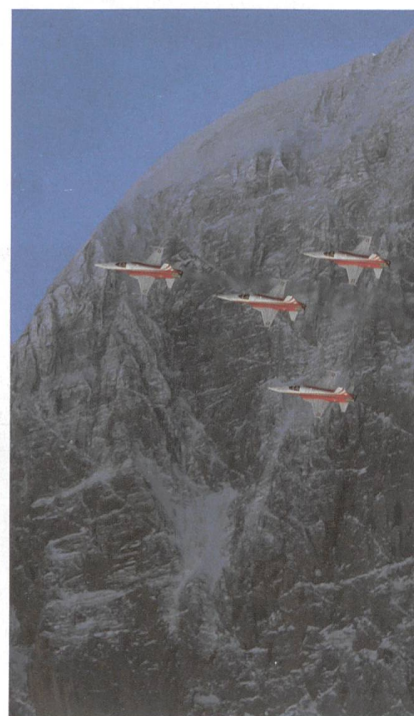
Lauberhorn-Rennen: Patrouille Suisse.