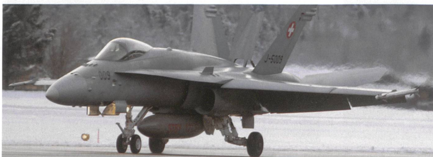
J-5009 im tiefverschneiten Meiringen.

Und zum Dessert zwei unverrückbare Schweizer Grössen auf einem Bild: Die Patrouille Suisse am Lauberhorn-Rennen vor der Eigernordwand. – fk.