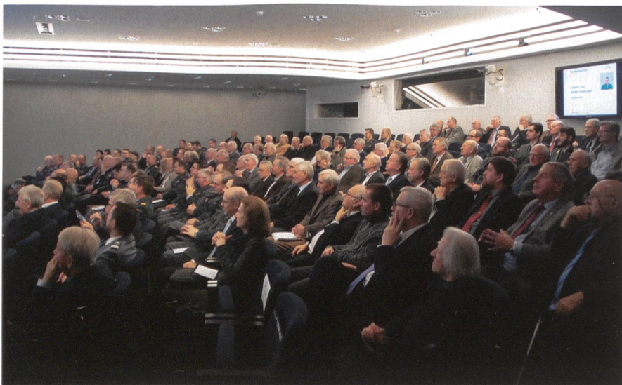
Der Mitgliederanlass fand im voll besetzten Forum St. Peter (Credit Suisse) statt.