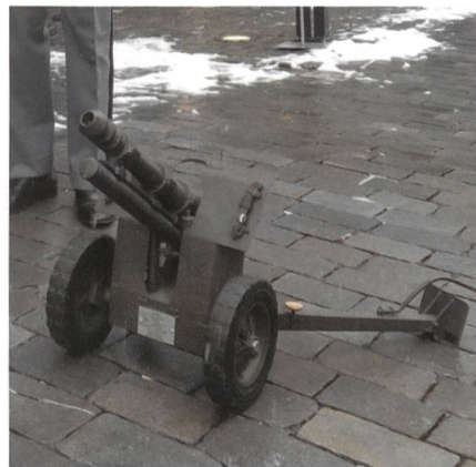
Auf dem geschichtsträchtigen «Goldenen Boden» zu Wil wird das Jahr jeweils mit zwei Salutsalven aus diesem gezogenen Miniaturgeschütz begrüsst.