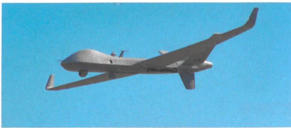
MQ-9B SkyGuardian mit bahnbrechendem Kollisionsvermeidungssystem.

Australien hat sich zum Kauf einer Flotte unbemannter Aufklärungsflugzeuge der Kategorie MALE UAS von General Atomics Aeronautical Systems (GA-ASI) entschlossen. Insgesamt sollen zwischen 12 und 16 ferngesteuerte Flugzeuge der MQ-9 Serie beschafft werden. Die Inbetriebnahme der Systeme durch die Royal Aus-