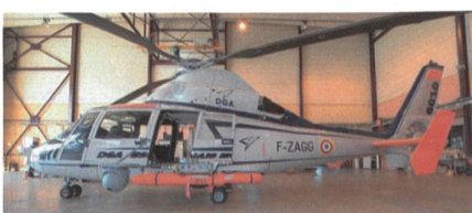
Erfolgreicher Schussversuch der Sea Venom-ANL.

Die Anti-Schiffsrakete Sea Venom-ANL von MBDA hat erfolgreich einen weiteren Schussversuch durchgeführt und damit einen wichtigen neuen Meilenstein für das anglo-französische Kooperationsprogramm