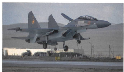
Su-30SM der kasachischen Luftwaffe.

Laut den kasachischen Luftstreitkräften kann die Su-30SM mit Anti-Radar- und Anti-Schiff-Lenkflugkörpern, Luft-Luft-Lenkflugkörpern mit mittlerer und kurzer Reichweite sowie hochpräzisen Lenkbomben eingesetzt werden. Patrick Nyfeler