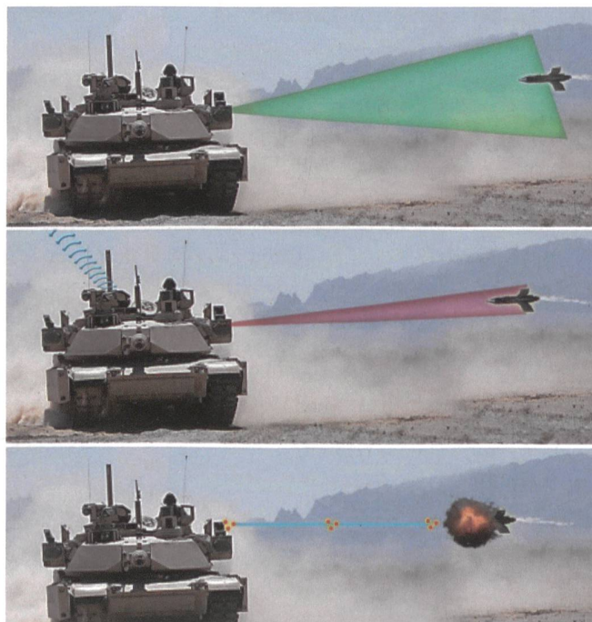
Geschoss entdecken, erfassen und sofort zerstören.