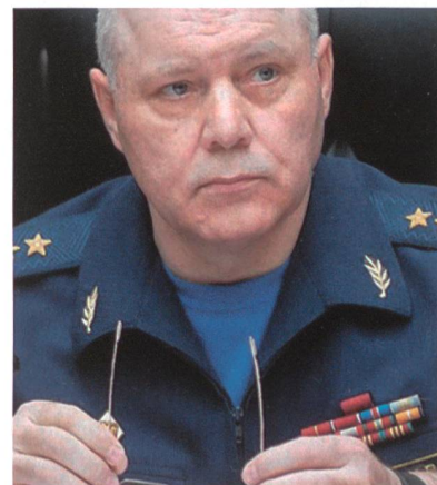
62-jährig gestorben: Igor Korobow.

2014 führte er GRU-Operationen in der Ost-Ukraine, weshalb ihn die USA auf die Sanktionsliste nahmen und ihm die Einreise verboten.