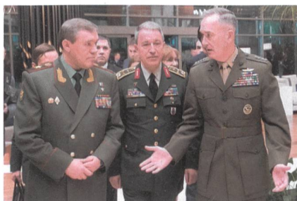
2017: Die Generäle Gerassimow (Russland), Akar (Türkei), Dunford (USA).

Ins Fäustchen lacht sich, einmal mehr, Präsident Putin. Das Vakuum im Nordosten kann seinen Schützling al-Asad stärken. Die Weltmacht USA zieht ab, Putin