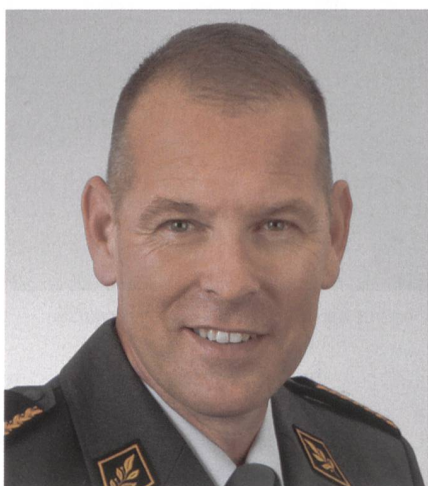
Br Laurent Michaud wird Stv Kdt KFOR.

Erstmals wird ein Schweizer Offizier die Stelle des stellvertretenden Kommandanten der internationalen Kosovo Force (KFOR) besetzen. Es handelt sich um Brigadier Laurent Michaud. Er übernimmt diese neue Funktion im September 2019 für ein Jahr. Die Ernennung unterstreicht das langjährige Engagement der Schweizer Armee für Sicherheit und Stabilität im Kosovo. Der Bundesrat hat von der Entsendung in seiner Sitzung vom 14. November 2018 Kenntnis genommen.