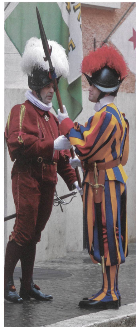
Der Kdt, Oberst Graf, überreicht einem vom Vize-Korporal zum Korporal beförderten Unteroffizier die Lanze.