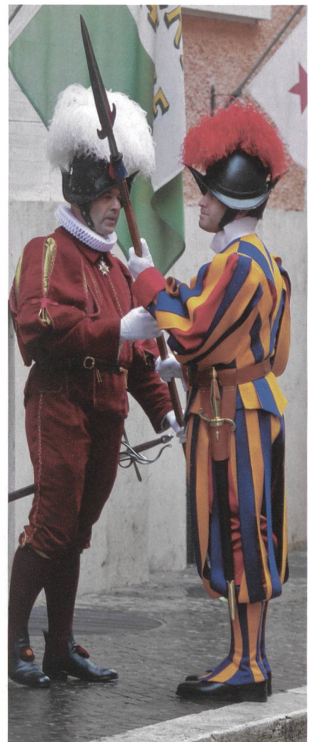
Der Kdt, Oberst Graf, überreicht einem vom Vize-Korporal zum Korporal beförderten Unteroffizier die Lanze.