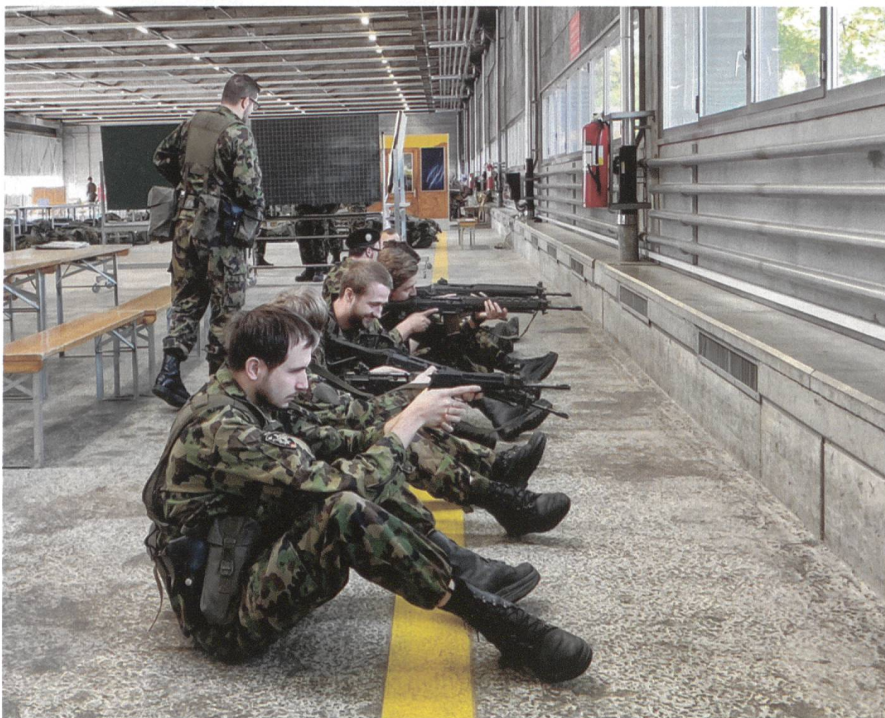
Übung macht den Meister. Training an der persönlichen Waffe.

Solche Echteinsätze werden von den Soldaten und Kadern immer geschätzt, da sie ihr Können vielen hochrangigen Offizieren unter Beweis stellen können.