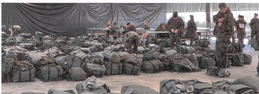
Der Bat Kdt resümiert: «Der Mobilmachungsprozess funktioniert.»