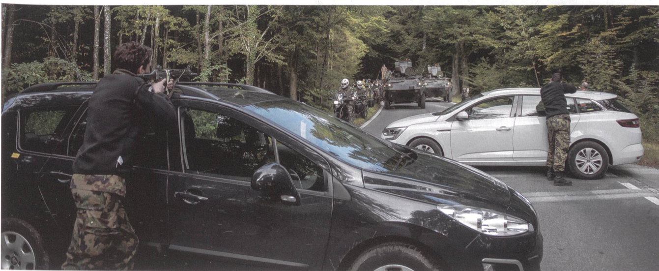
Dramatische Zuspitzung auf dem Weg vom Flugplatz zum Konferenzstandort: Der VIP-Konvoi gerät in einen Hinterhalt!