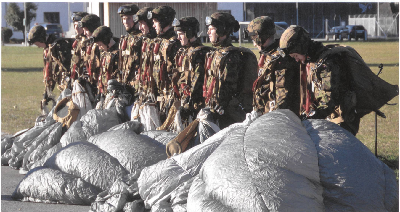
Zwölf Fallschirmaufklärer auf dem Militärflugplatz Locarno zur Brevetierung bereit: fünf Wachtmeister und sieben Leutnants.