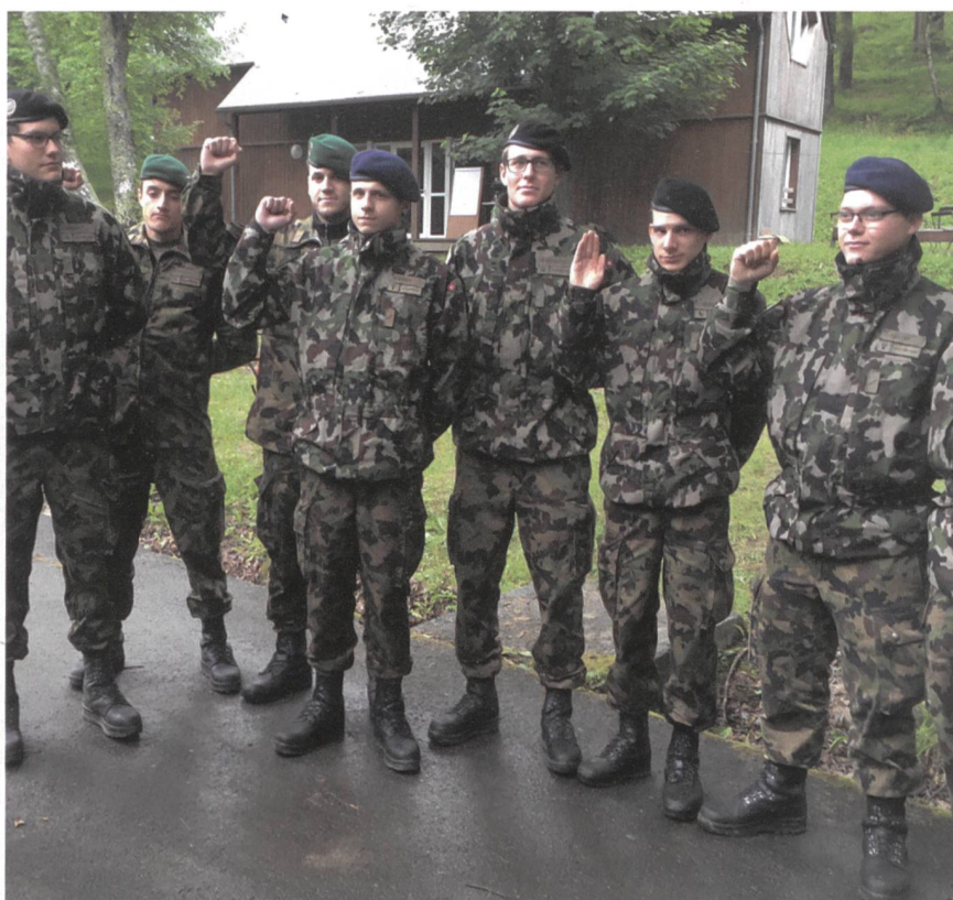
Ein Detachement von 50 Soldaten aus den RS vertrat die junge Generation.