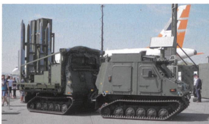
IRIS-T SLS auf Hägglunds Bv410.

Die griechische INTRACOM Defense Electronics (IDE) hat angekündigt, die Zusammenarbeit mit dem deutschen Unternehmen Diehl Defence durch die Unterzeichnung eines Fünfjahres-Rahmenvertrages im Wert von 10 Millionen Euro