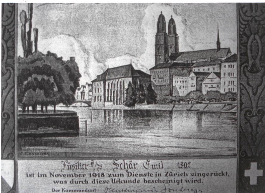
Dankesurkunde mit lithographischem Bild von Wasserkirche und Grossmünster.