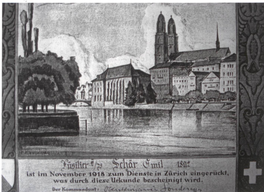
Dankesurkunde mit lithographischem Bild von Wasserkerche und Grossmünster.