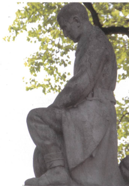
Das Soldatendenkmal in Frauenfeld. Es wurde aus der Symmetrieachse des Platzes an eine Zeughauswand verbannt. Die vier Bronzetafeln mit den Namen der verstorbenen Wehrmänner wurden in einem barbarischen Akt entfernt.