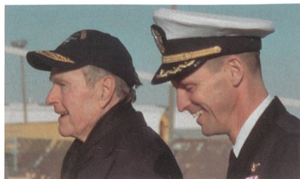
George H.W. Bush bei der Schiffstaufe.