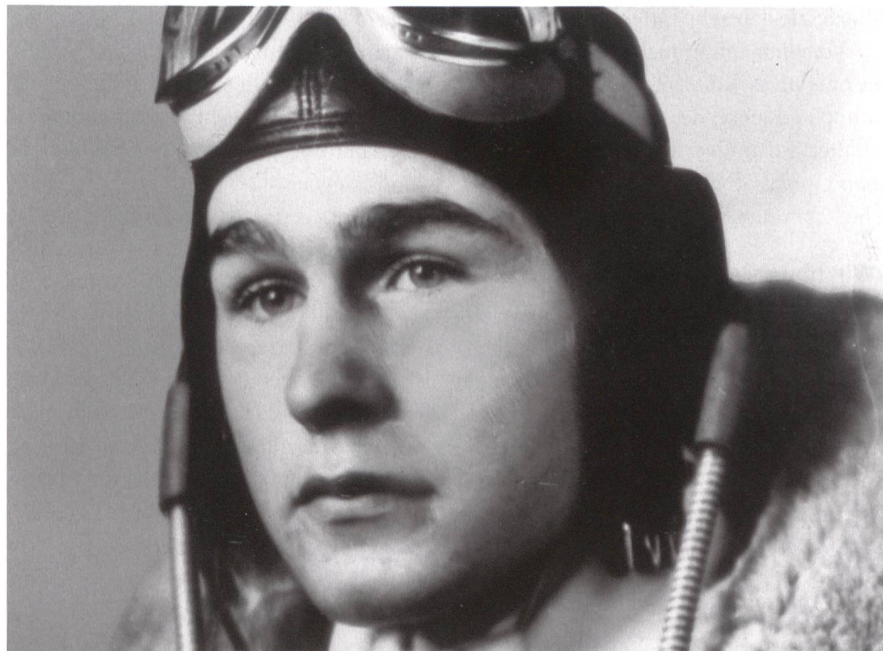
George H.W. Bush, vom Juni 1944 an der jüngste Marineflieger im Pazifikkrieg.