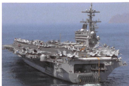
Träger USS George H.W. Bush, CVN-77.