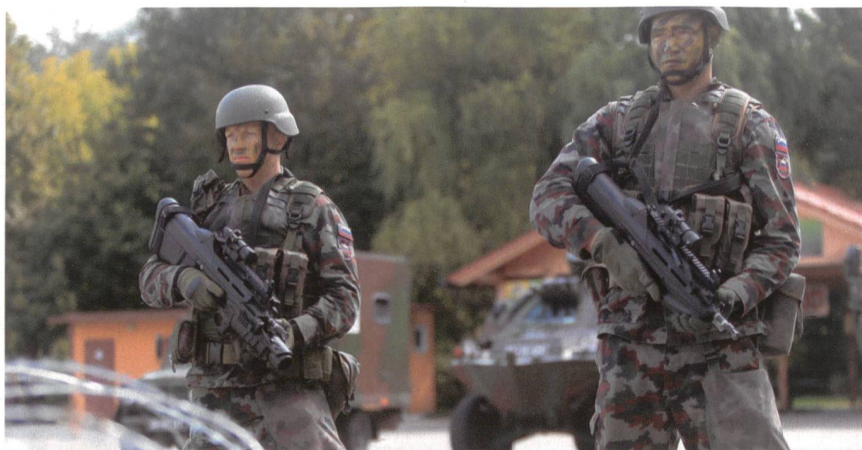
24. Kontingent der Slowenen im Libanon. Hinten ein Radschützenpanzer Pandur.