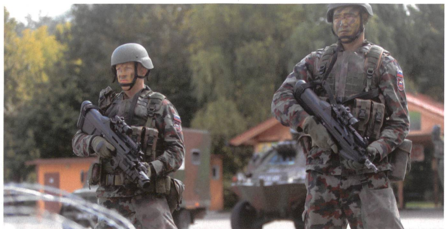
24. Kontingent der Slowenen im Libanon. Hinten ein Radschützenpanzer Pandur.

Angestrebt wird ein Gesamtbestand von 10'000 Mann. Zu den Schwächen gehört die Rekrutierung. iiss.