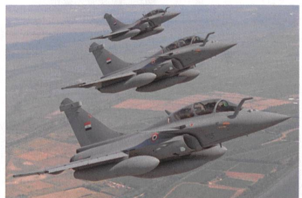
Bewerber 5: Rafale von Dassault.