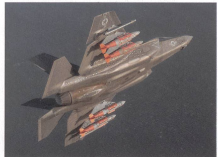
Bewerber 3: F-35 von Lockheed Martin.