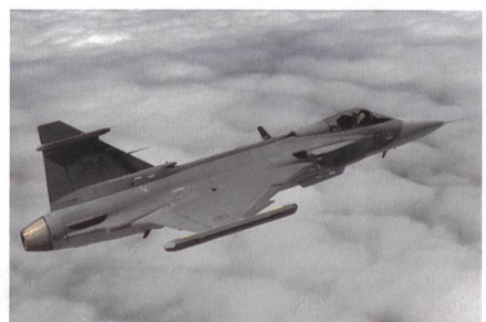
Bewerber 4: Gripen-E von Saab.