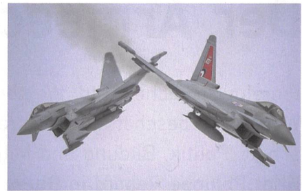
Bewerber 1: Eurofighter von Airbus.