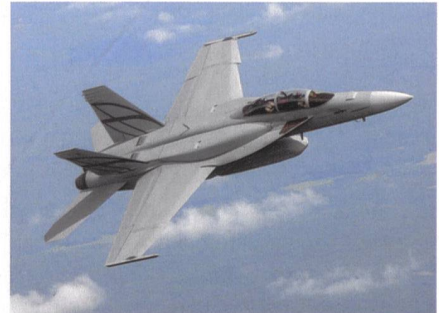
Bewerber 2: F/A-18E/F von Boeing.