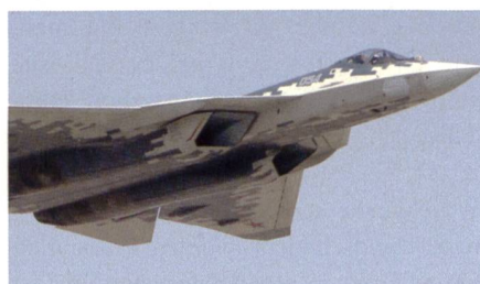
Su-57: Serienproduktion ist angelaufen.

Die erste Maschine aus der Serienfertigung soll noch 2019 an die russische Luftwaffe übergeben werden. Auf der Rüstungsmesse Armija 2019 Ende Juni in Kubinka hatten die Regierung und Suchoi einen Staatsvertrag über die Lieferung einer nicht näher definierten «Charge» von Su-57 unterzeichnet. Diversen Agenturberichten zufolge beläuft sich diese Charge