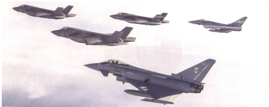
Eurofighter und F-35 im Formationsflug.

Die Fighter-Flotte der britischen Luftwaffe ist so klein wie nie: Nur noch 119 Kampfflugzeuge befinden sich gegenwärtig im Inventar der Royal Air Force. Gegenwärtig besteht das britische Fighter-Arsenal aus lediglich 119 Flugzeugen, davon 102 Euro-