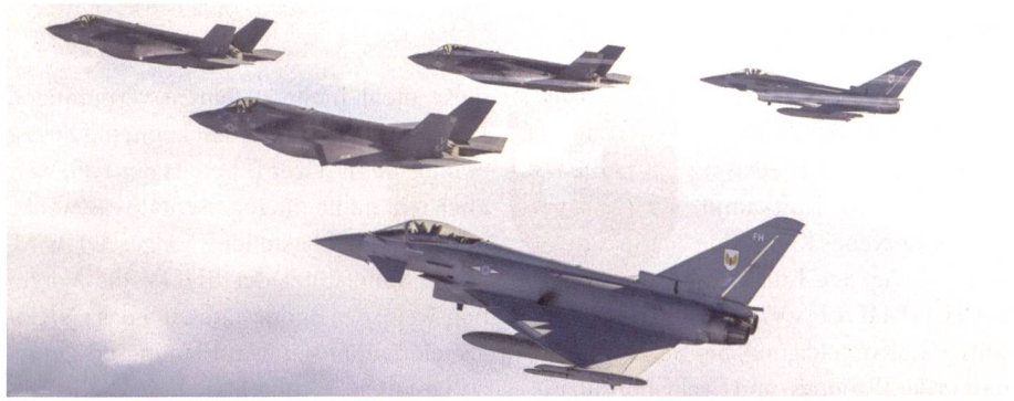
Eurofighter und F-35 im Formationsflug.

Die Fighter-Flotte der britischen Luftwaffe ist so klein wie nie: Nur noch 119 Kampfflugzeuge befinden sich gegenwärtig im Inventar der Royal Air Force. Gegenwärtig besteht das britische Fighter-Arsenal aus lediglich 119 Flugzeugen, davon 102 Euro-