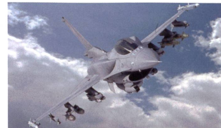
Die neueste Version der Fighting Falcon.