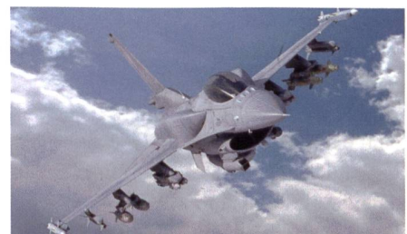
Die neueste Version der Fighting Falcon.