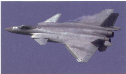
Neues Trägerflugzeug Chengdu J-20.

Der von Chengdu Aerospace Corporation (CAC) entwickelte J-20 hat sich demgemäss gegenüber dem von Shenyang Aircraft Corporation (SAC) vorgestellten F-31 durchgesetzt, welche das bisherige Trägerflugzeug J-15 herstellt. Beides