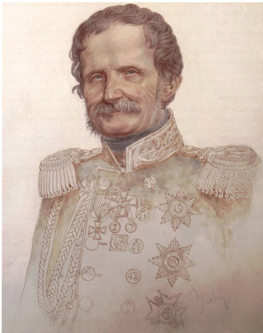
Baron Antoine-Henri Jomini. Seines 150. Todestages wurde gedacht.