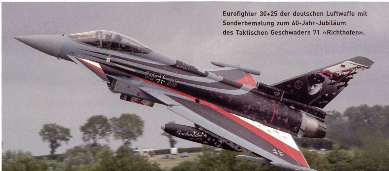
Eurofighter 30+25 der deutschen Luftwaffe mit Sonderbemalung zum 60-Jahr-Jubiläum des Taktischen Geschwaders 71 «Richthofen».