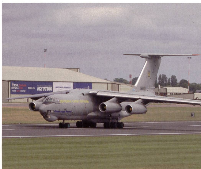
Vierstrahlige IL-76 Transportmaschine aus der Ukraine.