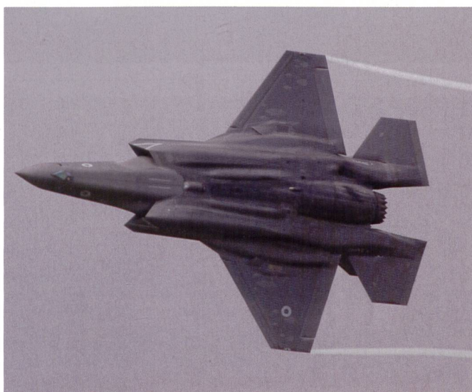
F-35B der Royal Air Force 617 Squadron.