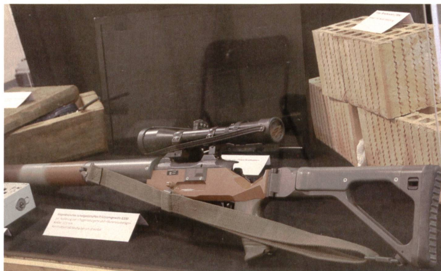
Spezialgewehr G150 mit Zielfernrohr und Schalldämpfer von SIG Neuhausen.