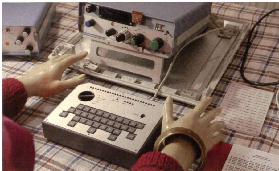
Kurzwellensender PHOENIX, getarnt als Schreibmaschine zur Heimabgabe.