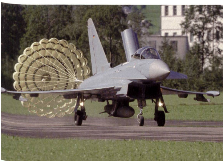
Ein Eurofighter Thypoon landet in Mollis mit Bremschirm.