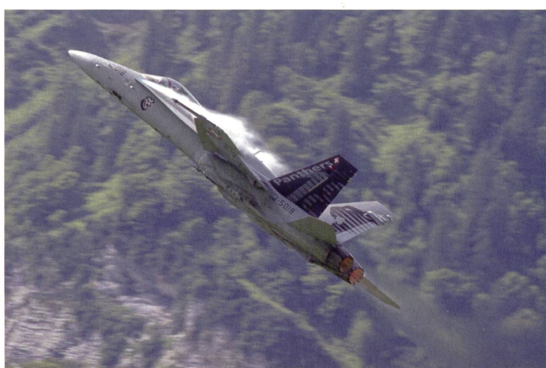
Die Staffelmachine J-5018 der Fliegerstaffel 18 in Mollis.