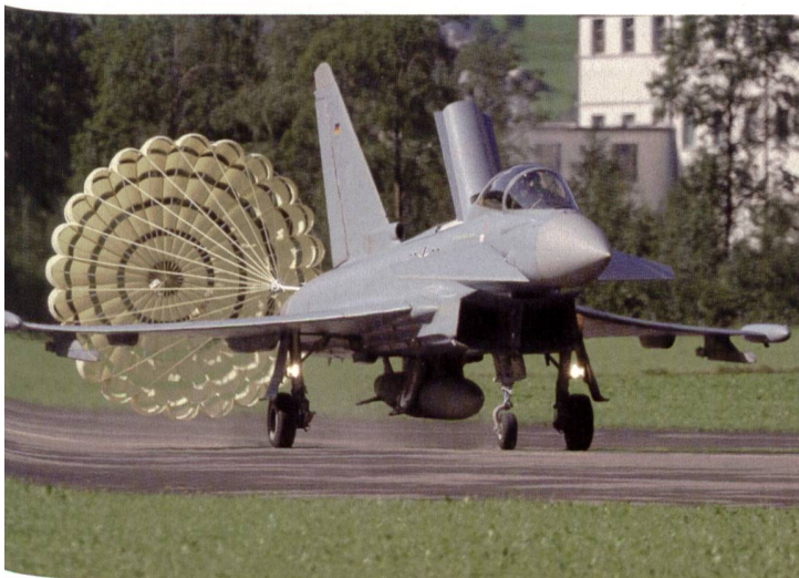
Ein Eurofighter Thyphoon landet in Mollis mit Bremschirm.