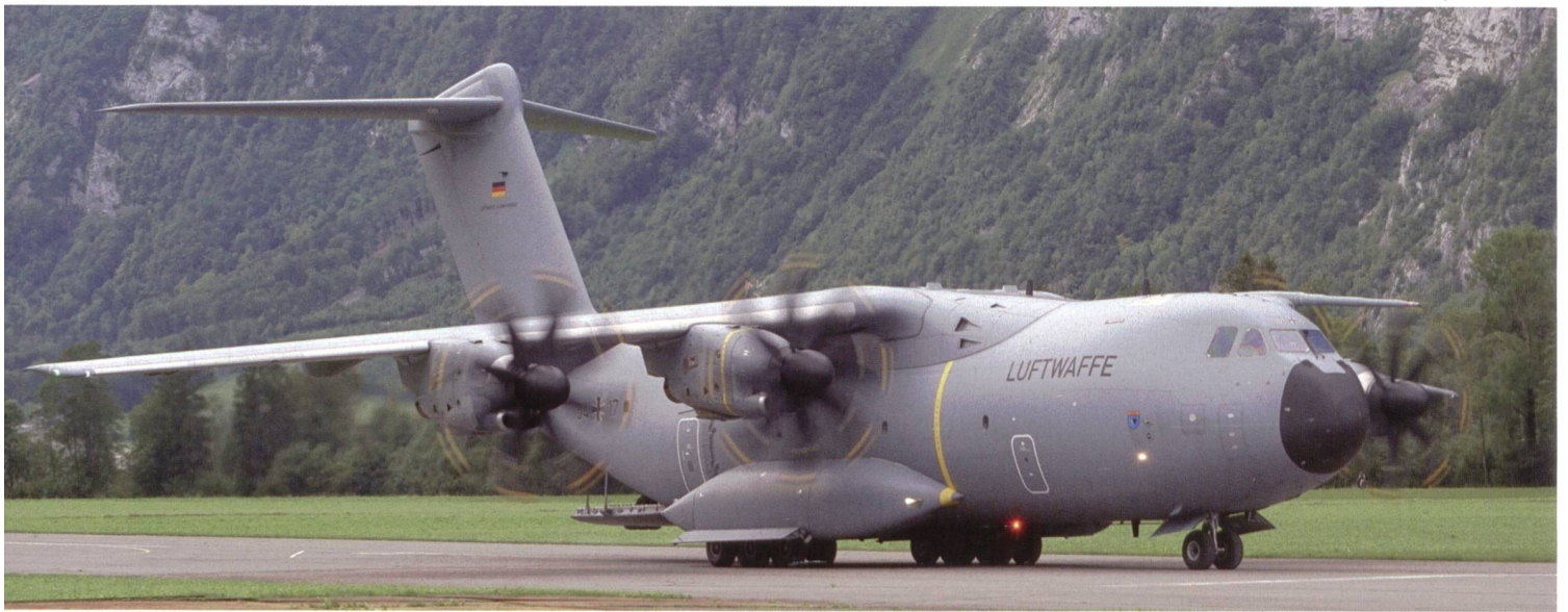
Die mächtige A400M-Transportmaschine von Airbus gehörte zu den Attraktionen. Ein Flugzeug der deutschen Luftwaffe.