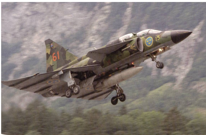
Der Viggen in grüner Tarnbemalung wurde stark beachtet.