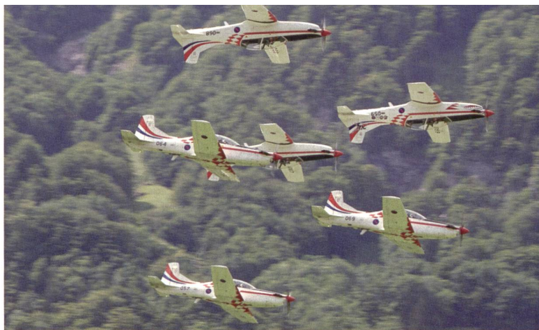
Das kroatische Kunstflugteam «Krila Oluje» mit Pilatus PC-9M.